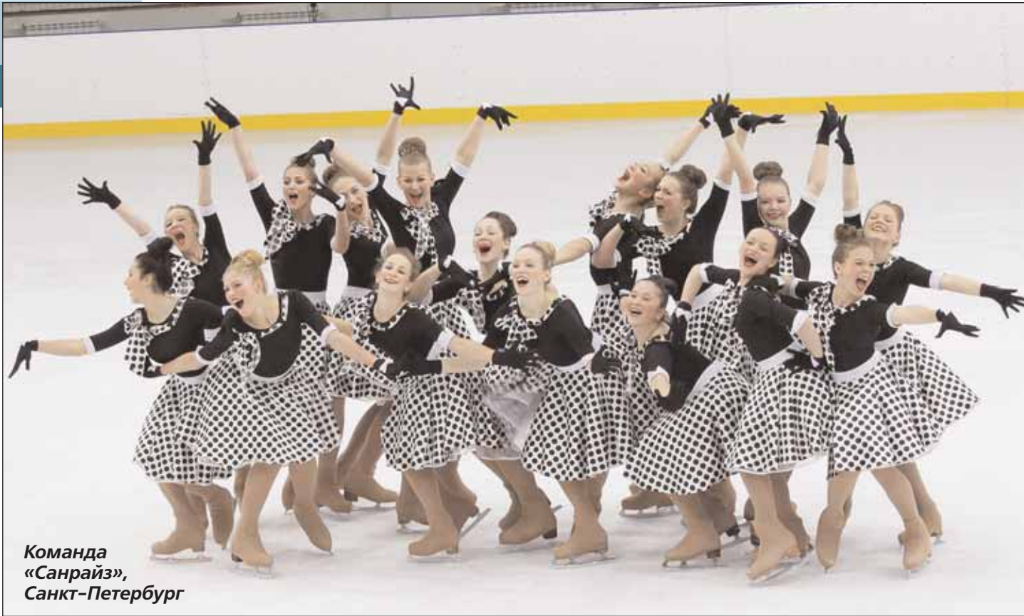
Команда «Санрайз», Санкт-Петербург