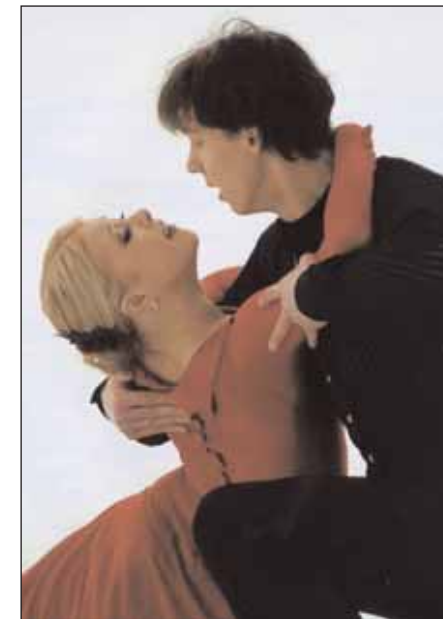
№1/2011 Московский фигурист

«Перед нами стояла главная задача — в произвольном танце показать, кроме техники, еще и эмоции»