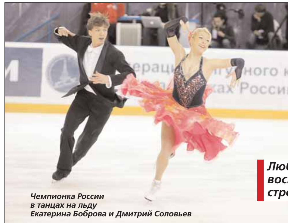
Чемпионка России в танцах на льду Екатерина Боброва и Дмитрий Соловьев

— Я не хотела бы кого-то особенно выделять, потому что, мне кажется, каждая школа имеет свое лицо. Где-то лучше получается, где-то, может быть, не такие блестящие результаты. Конечно, педагогический коллектив где-