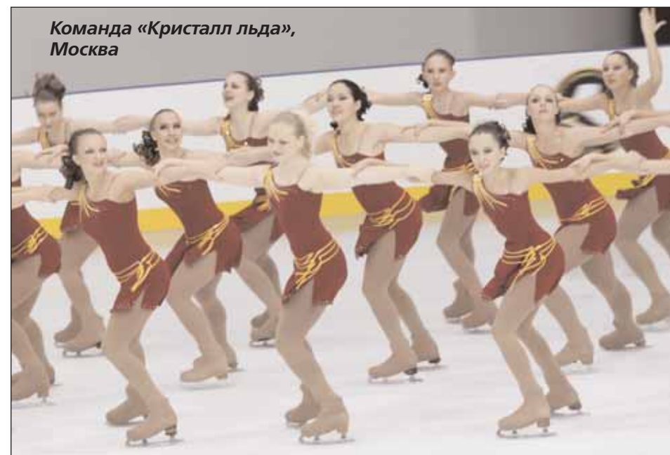
Команда «Кристалл льда», Москва

Команда готовится к старту, то продумывает свой стиль до мелочей: прически у всех одинаковые, цвет лака на ногтях один и тот же, сережки, макияж одинаковые. И на соревнованиях все друг друга разглядывают, узнают, из какой команды. Сейчас я понимаю, что судьям ничего этого не видно: ни причесок, ни ногтей, ни макияжа, ни сережек, а это всего лишь боевой настрой команды.