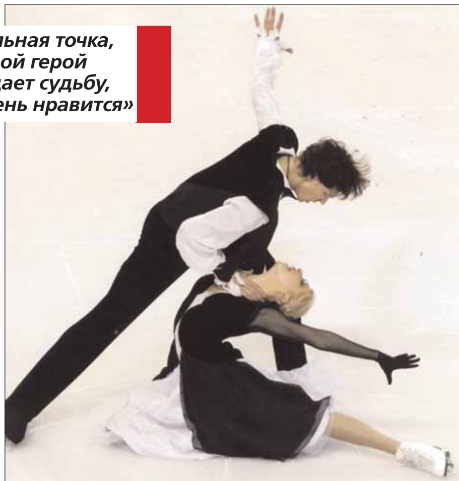
Московский фигурист №1/2011

«Финальная точка, когда мой герой побеждает судьбу, мне очень нравится»