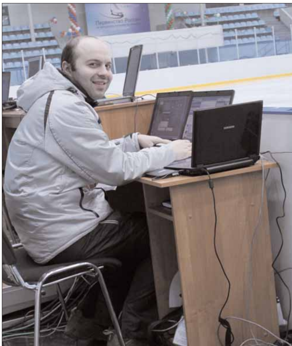
Московский фигурист №1/2011

Сегодня технологии стремительно меняются. Если раньше специалист технического профиля знал, что навыки и знания, которые он получил в вузе, достаточны и будут служить практически всю жизнь, то сейчас понимаешь, что все, чему ты научился, морально устареет практически сразу. Поэтому важно уметь постоянно обновлять свои знания, тем более что новые технологии позволяют нам это делать. Мы живем в открытом обществе, в котором есть доступ к различным ресурсам. Нам достаточно включить общественный