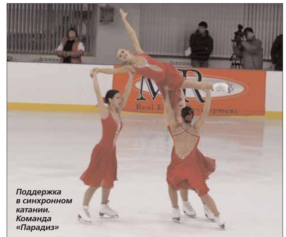
Поддержка в синхронном катании. Команда «Парадиз»

— Действительно, если фигурное катание как спорт насчитывает долгую, более 100 лет, историю, то синхронное катание совсем молодой вид спорта и до конца неясно, останется ли он в том виде, в каком существует сейчас, или будут еще какие-то изменения. Однако в настоящее время синхронное катание является таким сложным видом спорта, что трудно представить, что возможно его усложнить. Например, исполня-