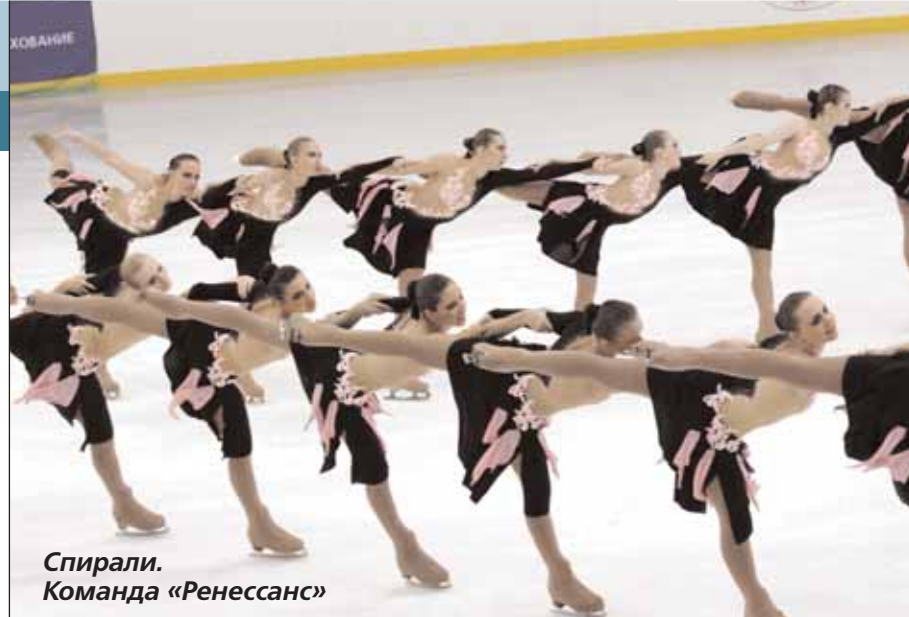
Спираль. Команда «Ренессанс»

ко судьи влияют на развитие синхронного катания своими требованиями и правилами?