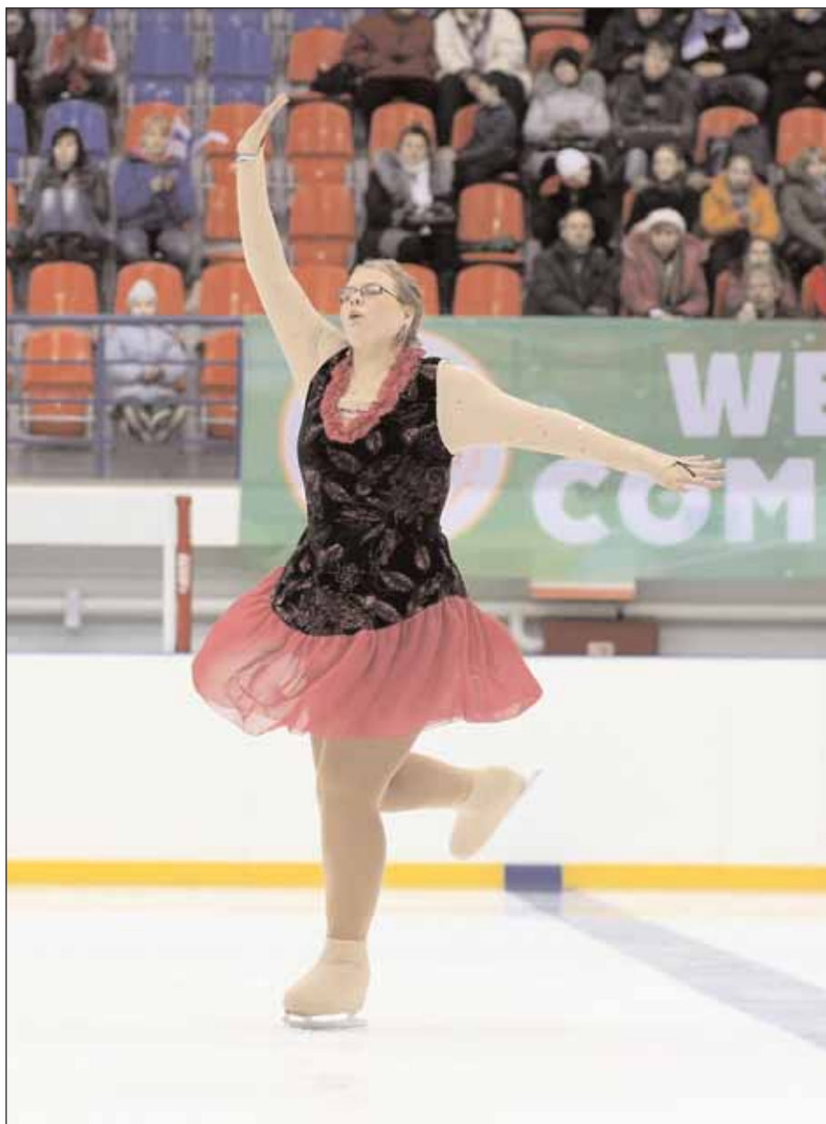
Московский фигурист №1/2011

Special Olympic International — это международная программа, в которой