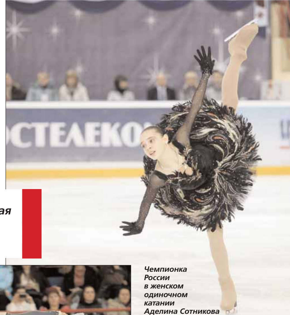
Чемпионка России в женском одиночном катании Аделина Сотникова

— В Саранске на чемпионате России Москва завоевала три золотые медали. Безусловно, это очень весомый успех, ведь мы конкурируем практически только с Петербургом в мужском одиночном катании.