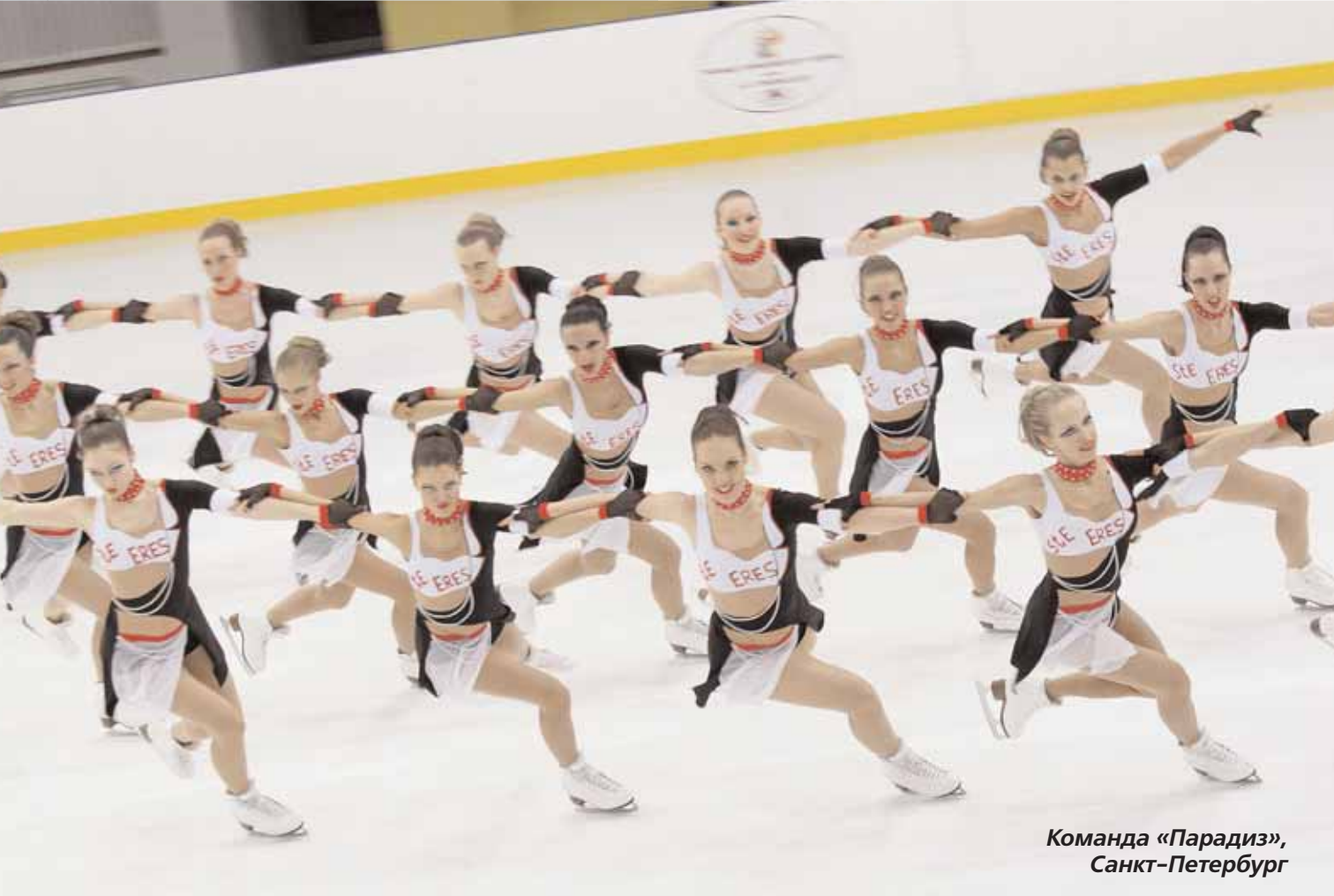
Команда «Парадиз», Санкт-Петербург

кажется, поняла, что зря с этим вступлением тянула так долго.