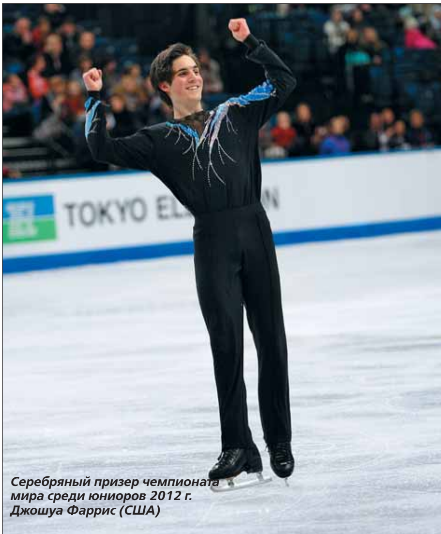
Серебряный призер чемпионата мира среди юниоров 2012 г. Джошуа Фаррис (США)

«Я чувствую себя очень гордым, — поделился с журналистами спортсмен, — поскольку я первый китаец, завоевавший такой титул на этом чемпионате. Сегодня моё выступление было довольно хорошим, я показал свой уровень. Место для меня не играет никакой роли, для меня гораздо более важно хорошо кататься. В Китае есть ещё поколение очень крутых спортсменов — и я надеюсь, что будет ещё много чемпионов из Китая».