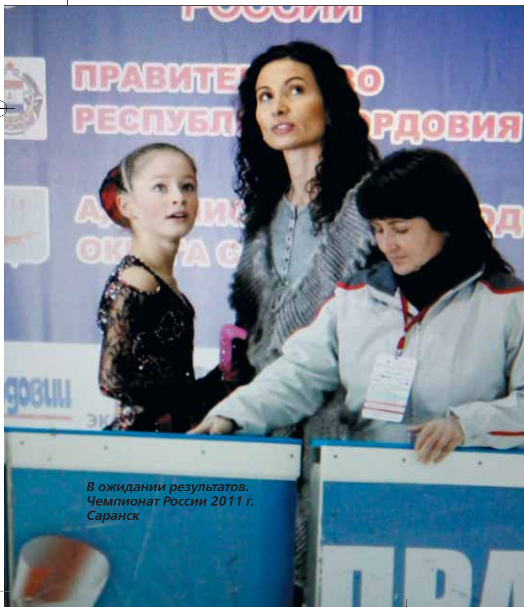
В ожидании результатов. Чемпионат России 2011 г. Саранск