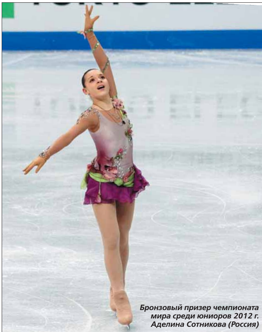
Бронзовый призер чемпионата мира среди юниоров 2012 г. Аделина Сотникова (Россия)

Может быть, оттого, что в фигурное катание изначально девочек приводят больше, чем мальчиков, и конкуренция здесь сильнее, уровень «девчачьего» катания казался в среднем выше, чем у мальчиков. →