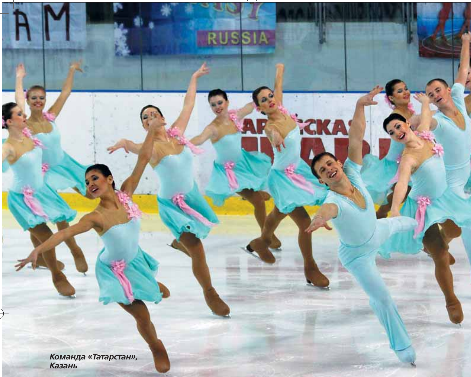
Команда «Татарстан», Казань