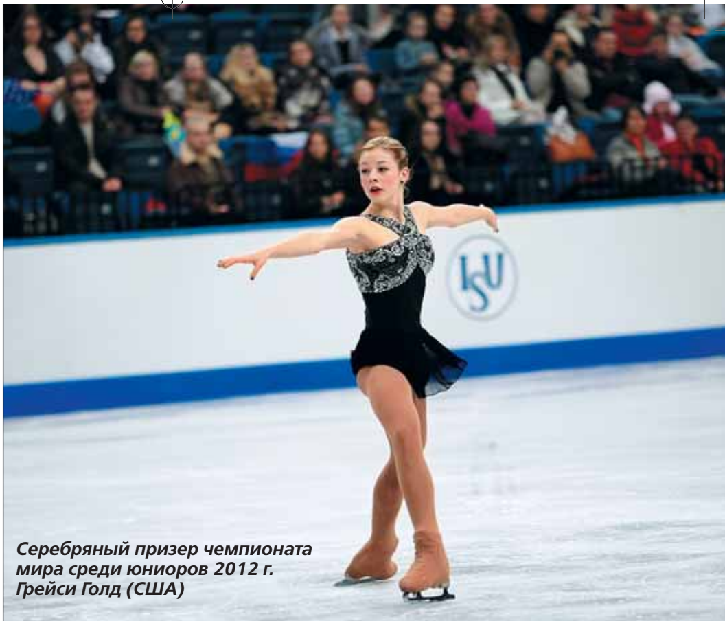
Серебряный призер чемпионата мира среди юниоров 2012 г. Грейси Голд (США)

В мире фигурного катания бытует мнение, что те, кто выигрывает юниорские чемпионаты мира, как правило, ничего не достигают на взрослом уровне. Шесть лет назад на золотой и серебряной ступеньке пьедестала юниорского чемпионата в Любляне стояли будущая олимпийская чемпионка Ванкувера Юна Ким и серебряный призер той же олимпиады Мао Асада. →