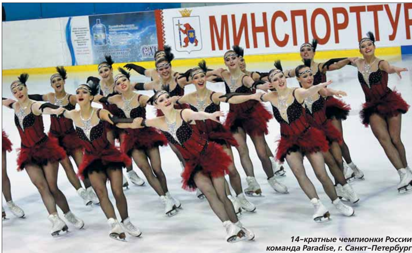
14-кратные чемпионки России команда Paradise, г. Санкт-Петербург

Беседовала Ольга ВЕРЕЗЕМСКАЯ Йошкар-Ола, январь 2012 г.