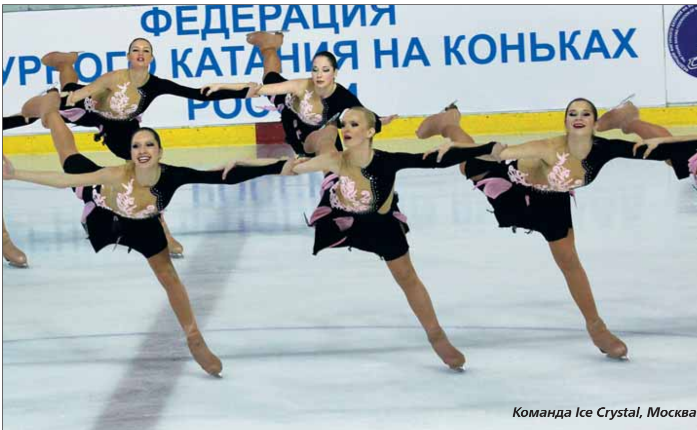
Команда Ice Crystal, Москва

— Мы решили, что нам нужен этот возраст, потому что спортсменам из младших команд надо на кого-то рав-