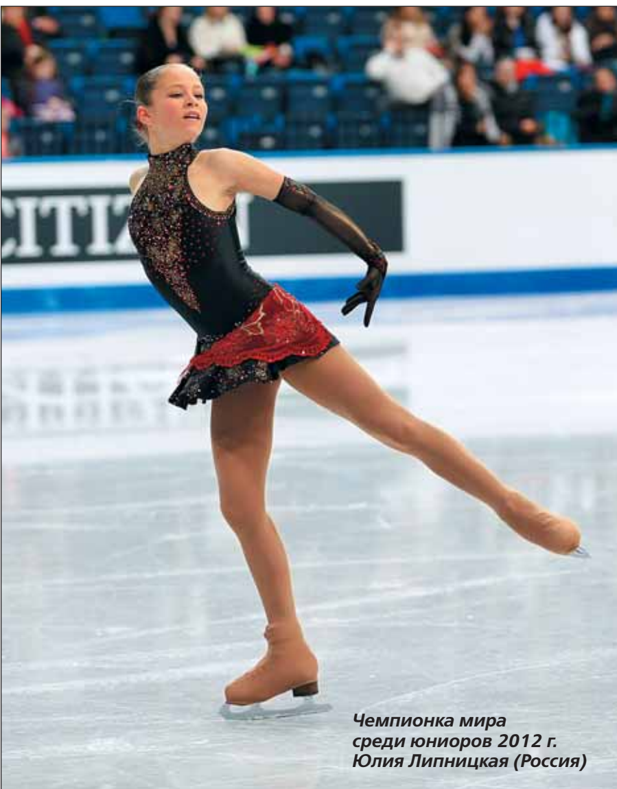
Чемпионка мира среди юниоров 2012 г. Юлия Липницкая (Россия)

В короткой программе 13 девушек из 31 намеревались сделать каскад 3-3 в разных вариациях. Исполнение удалось семерым, включая и наших. Самый сложный каскад тройной флип — тройной тулуп выполнила американка Грейси Голд, которая после первого дня разместилась на второй строке. «Я сегодня сделала все что могла, — призналась она, — и мне себя не в чем упрекнуть». Действительно, протокол состоял лишь