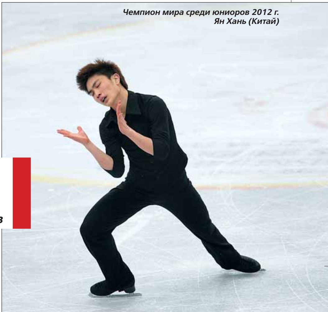
Чемпион мира среди юниоров 2012 г. Ян Хань (Китай)

— В чем была ошибка, из-за чего Жан Буш не исполнил прыжок, о котором мы говорим?