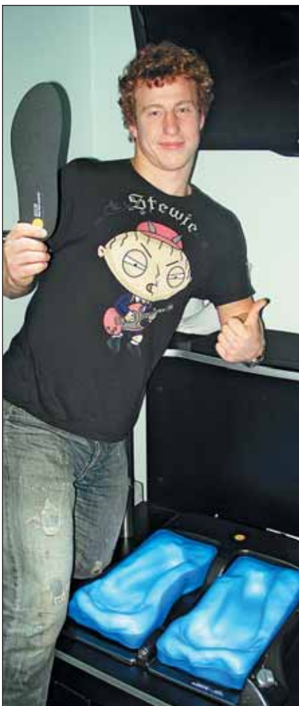
Фигурист Нодари Маисурадзе

За указанные сроки наша компания изготовила около 100 пар стелек, причем все отзывы или положительные или восторженные. Основные клиенты — начинающие фигуристы, однако есть и хоккеисты, и просто люди, желающие носить такие стельки в крос-