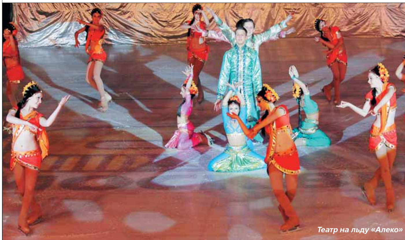
Театр на льду «Алеко»