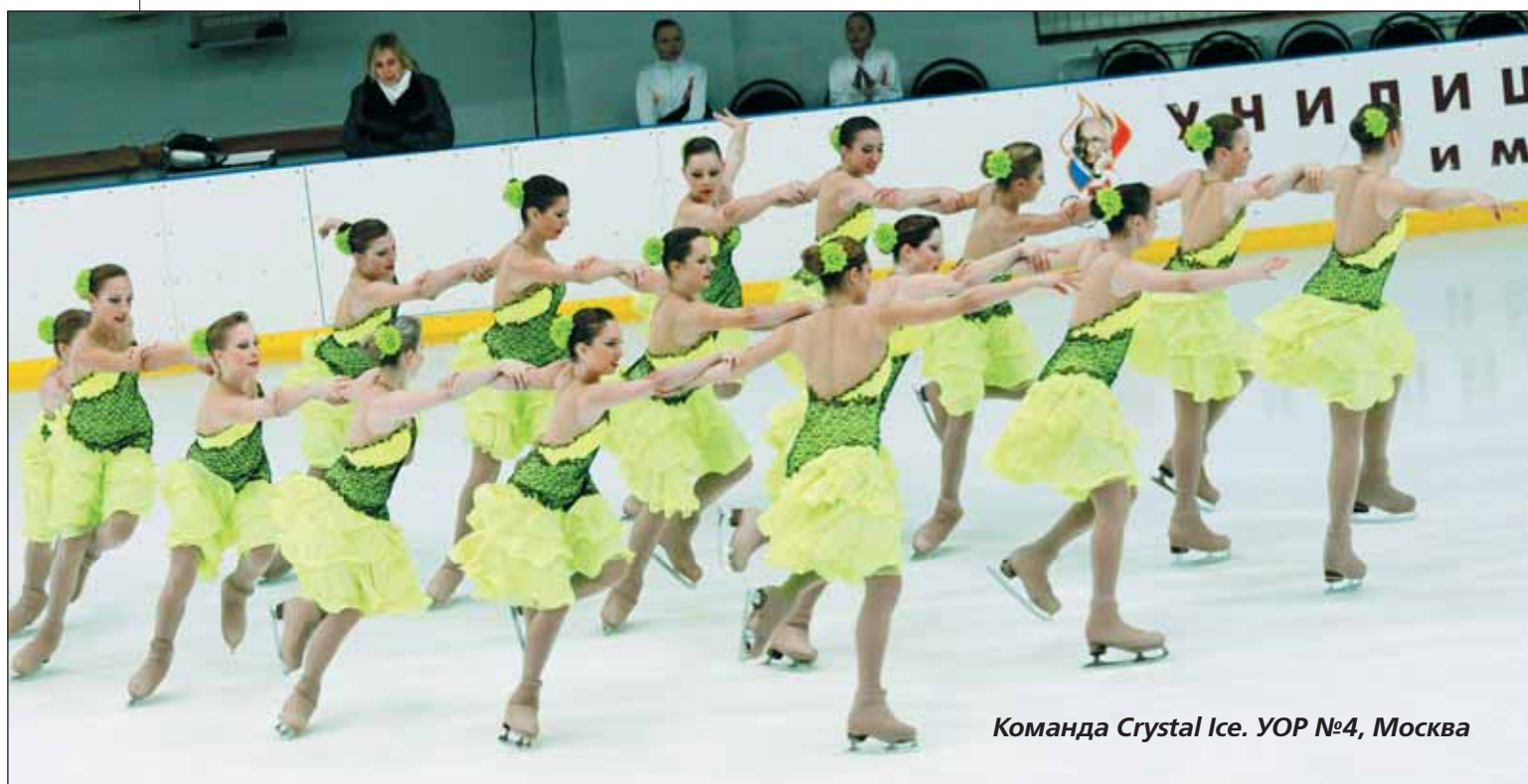
Команда Crystal Ice. УОР №4, Москва

● в связи с переходом в ГБОУ ДОД СДЮСШОР «Москвич» к тренеру Алек-