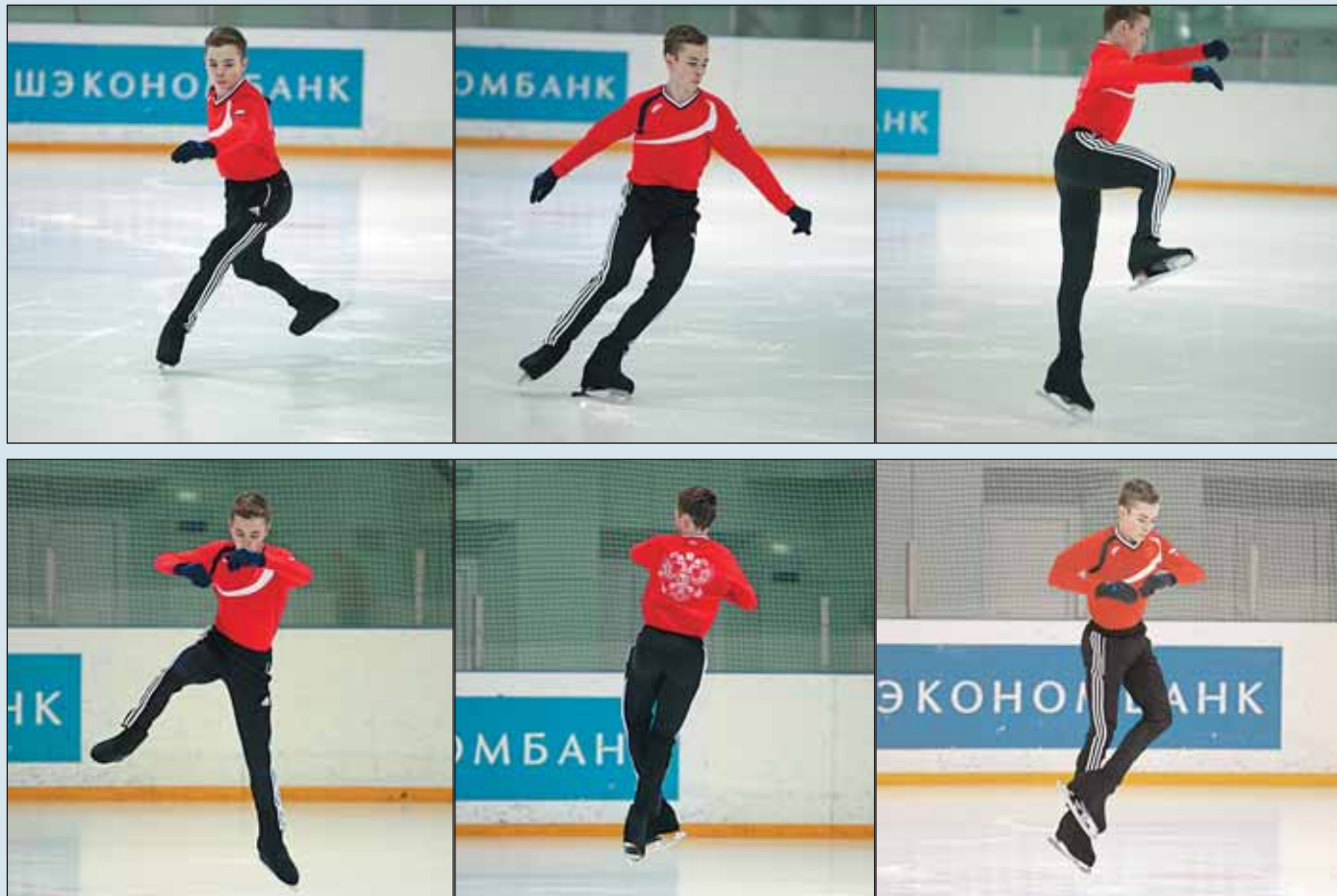
Прыжок Аксель: основные фазы