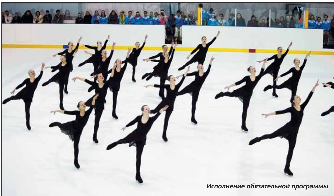
Исполнение обязательной программы

сыттить программу элементами фигурного катания, и это учитывается при выставлении оценок. Правда, все судейство осуществляется только судьями без технической бригады, и это принципиальная позиция организаторов.